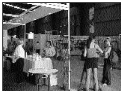
Medios de comunicación en Caprisur 2001

Guadalhorce se considera del mismo modo prioritario informar a la población e instituciones de fuera de la comarca de todas aquellas acciones que, desde el punto de vista del desarrollo rural, se dan en la comarca, así como de todos los aspectos que puedan llevar la comarca del Guadalhorce a los lugares más dispares.