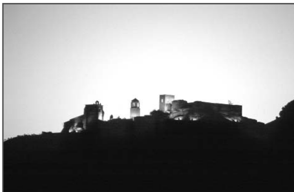
Castillo de Álora al atardecer