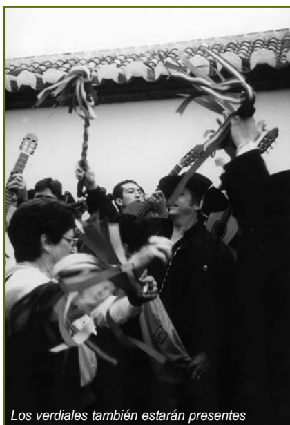
Los verdiales también estarán presentes

La muestra, que tendrá lugar el próximo 27 de febrero, tendrá como eje central la almendra y la cultura etnográfica que la rodea