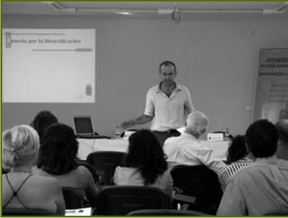
Durante las Jornadas de Textil, se presentó la línea de ayudas del GDR destinada a contribuir a la diversificación del sector textil

Con el objetivo de intentar apoyar a las mujeres que han pertenecido al sector textil, el GDR Guadalhorce apoya a aquellas empresas creadas por éstas o que se adapten a la incorporación de mujeres