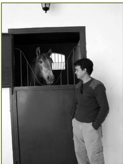
Actualmente la clínica cuenta con cuatro boxes para recuperación de los caballos

A.B.E.: Tiene una sala de reconocimiento con un potro para inmovilizar al animal, y luego tiene una habitación con paredes y suelo acolchados, que es donde se anestesia al caballo. De ahí el animal pasa a la mesa de operaciones gracias a una grúa que llega con un rail hasta el quirófano, donde ya se le entuba para mantenerlo anestesiado durante la intervención. Una vez operado vuelve a la sala acolchada, para que no se haga daño al despertar y posteriormente pasa a las cuadras de recuperación, donde están constantemente vigilados gracias a un sistema de cámaras. ■