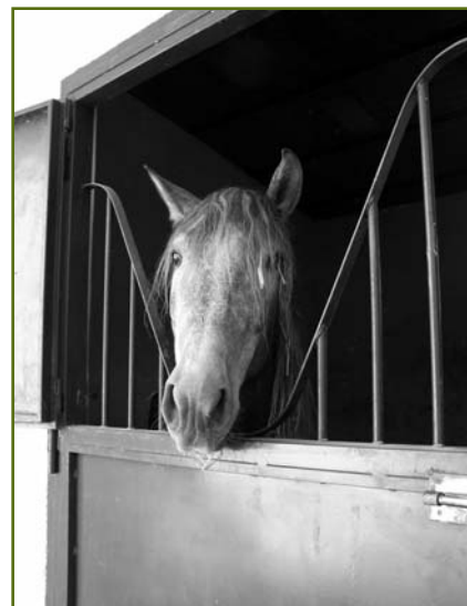
Uno de los ejemplares que están en recuperación en la clínica